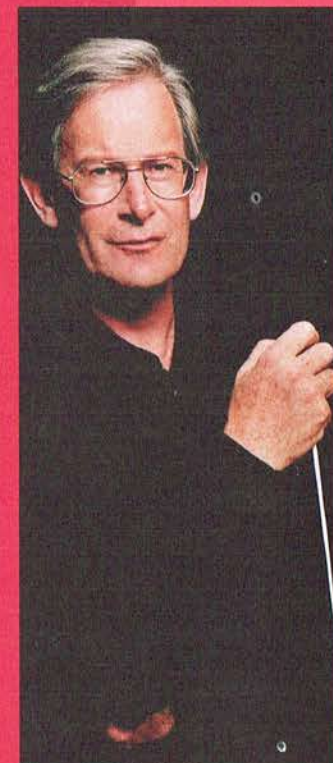
Sir John Eliot Gardiner