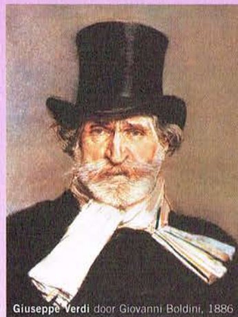
Giuseppe Verdi door Giovanni Boldini, 1886