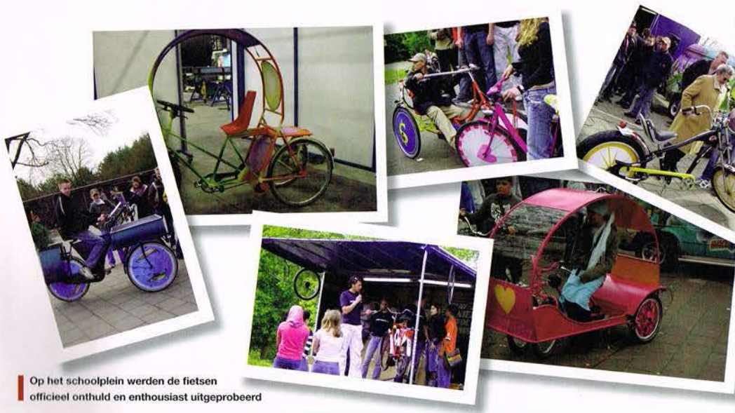
Op het schoolplein werden de fietsen officieel onthuld en enthousiast uitgeprobeerd

Gestimuleerd door het grote succes van deze eerste Bike-a-licious, besloot Bureau TOP in samenwerking met onder andere Batavus ook een fietsontwerpwedstrijd voor groep 7 van de basisschool uit te schrijven. Hier zijn maar liefst 2130 fietsontwerpen voor binnengekomen. De ontwerpen zijn allemaal beoordeeld en de vijf prijswinnaars zijn inmiddels bekend gemaakt. De klas van het winnende ontwerp kreeg een rondleiding bij fietsfabriek Batavus en een les fietstechniek. De bedoeling is komend jaar een nieuwe Bike-a-licious te starten, met hopelijk nog meer fantasie en fietsen.