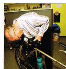
De zadels worden vakkundig op de fietsen gemonteerd en afgesteld