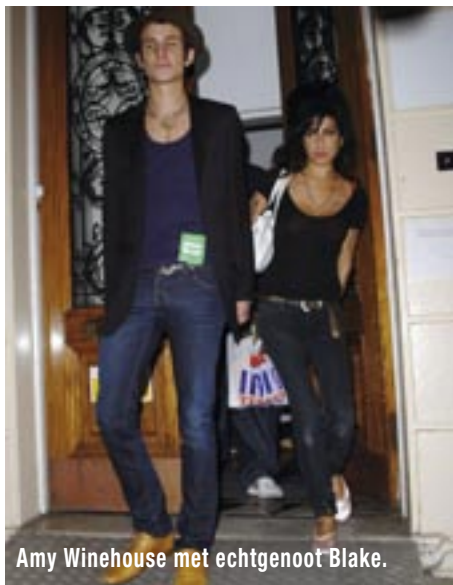
Amy Winehouse met echtgenoot Blake.

I'd rather be at home with Ray I ain't got seventeen days Coz there's nothing There's nothing you can teach me That I can't learn from Mr Hathaway (Rehab)