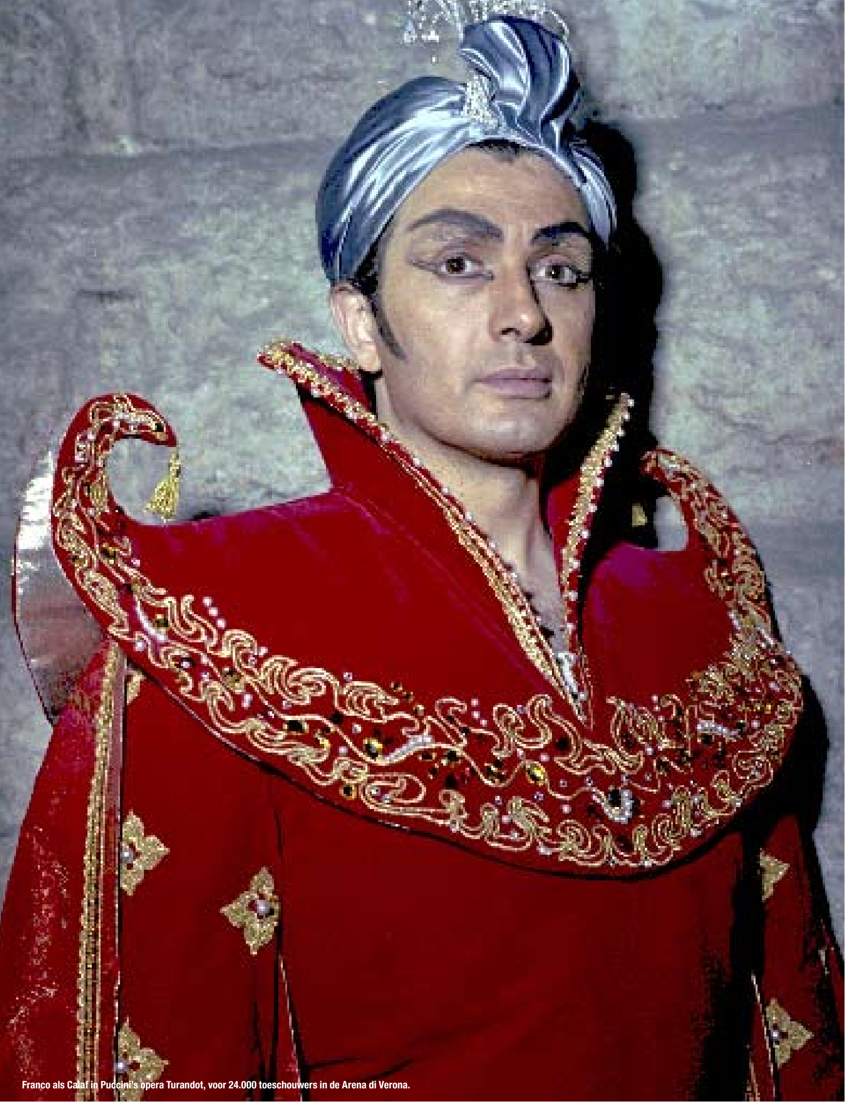
Franco als Calaf in Puccini's opera Turandot, voor 24.000 toeschouwers in de Arena di Verona.