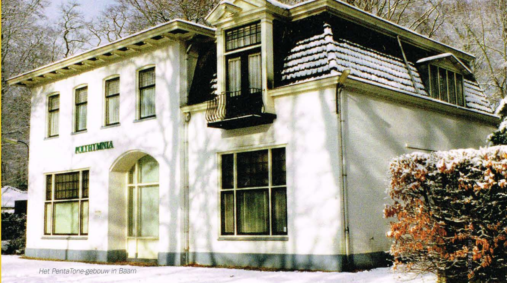
Het PentaTone-gebouw in Baarn