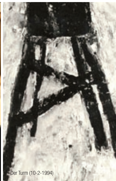
Der Turm (10-2-1994)