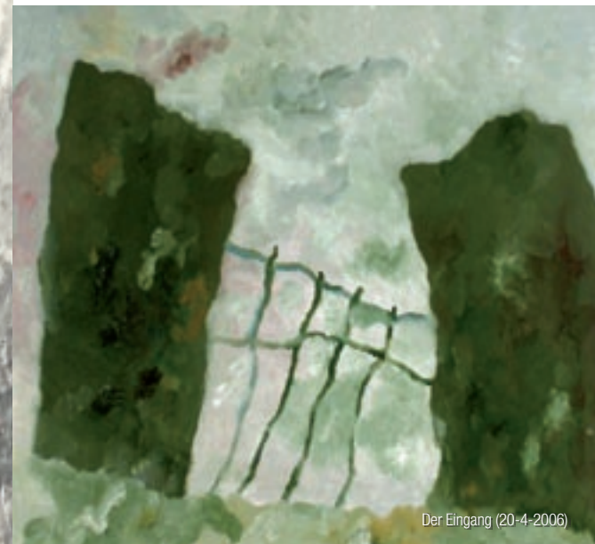
Der Eingang (20-4-2006)