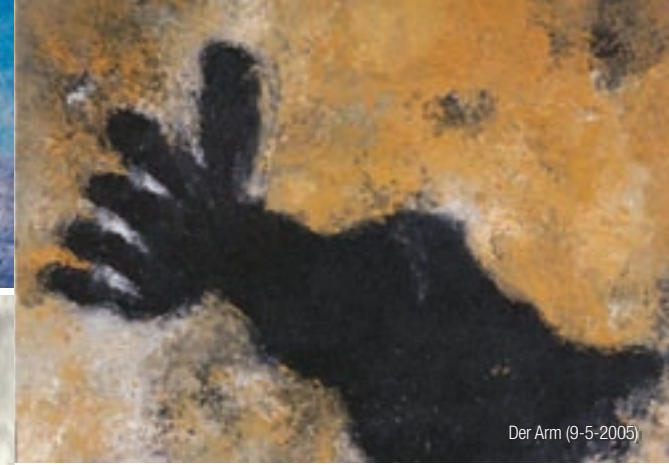
Der Arm (9-5-2005)